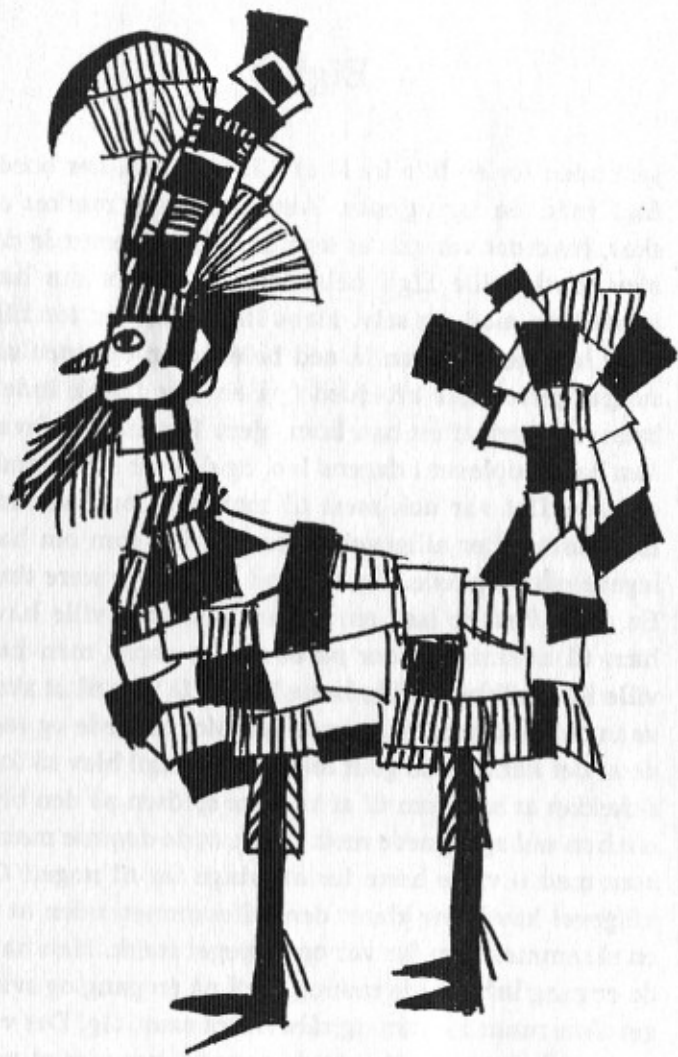
Eigil troede at skattevæsenet var et stort venligt dyr.

var et stort venligt dyr, fordi det sådan sendte penge, og fordi det hed noget med »skatte-«, for når mor var rigtig venlig ved far så han på hende på en bestemt måde og sagde noget med skattepige og fik en meget blød stemme. Men senere snakkede far om skattevæsenet på en anden måde, nærmest vredt, så Eigil blev klar over, at det væsen ikke altid var lige venligt. Eigil besluttede at drikke meget mælk og spise meget rugbrød for fremtiden, dobbelt så meget som ellers, så han i en fart kunne blive lige så stor og stærk som far, så han også kunne klare ti vilde heste, måske tolv! Men han måtte nok øve sig med et par stykker ad gangen i begyndelsen.