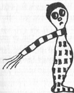
Snøvsen var en man gik fra.